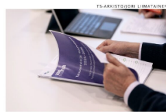
Pääoston valmistelu edellyttää tukea Varhan valtuustoryhmille.

voideflyttää olemuksen kaikkia asioita vain esityslistoja kahlittaen. Saman alan voi kysyä, onko Varhan puolueille säilyttämällä demokratiakasvatus toimintaa sillä tavalla kuin vajaan puolen miljoonan euron poilla voisi odottaa. Hyvinvointilauteluun valtuusto on jäänyt kansalliseksi kovin etäiseksi.