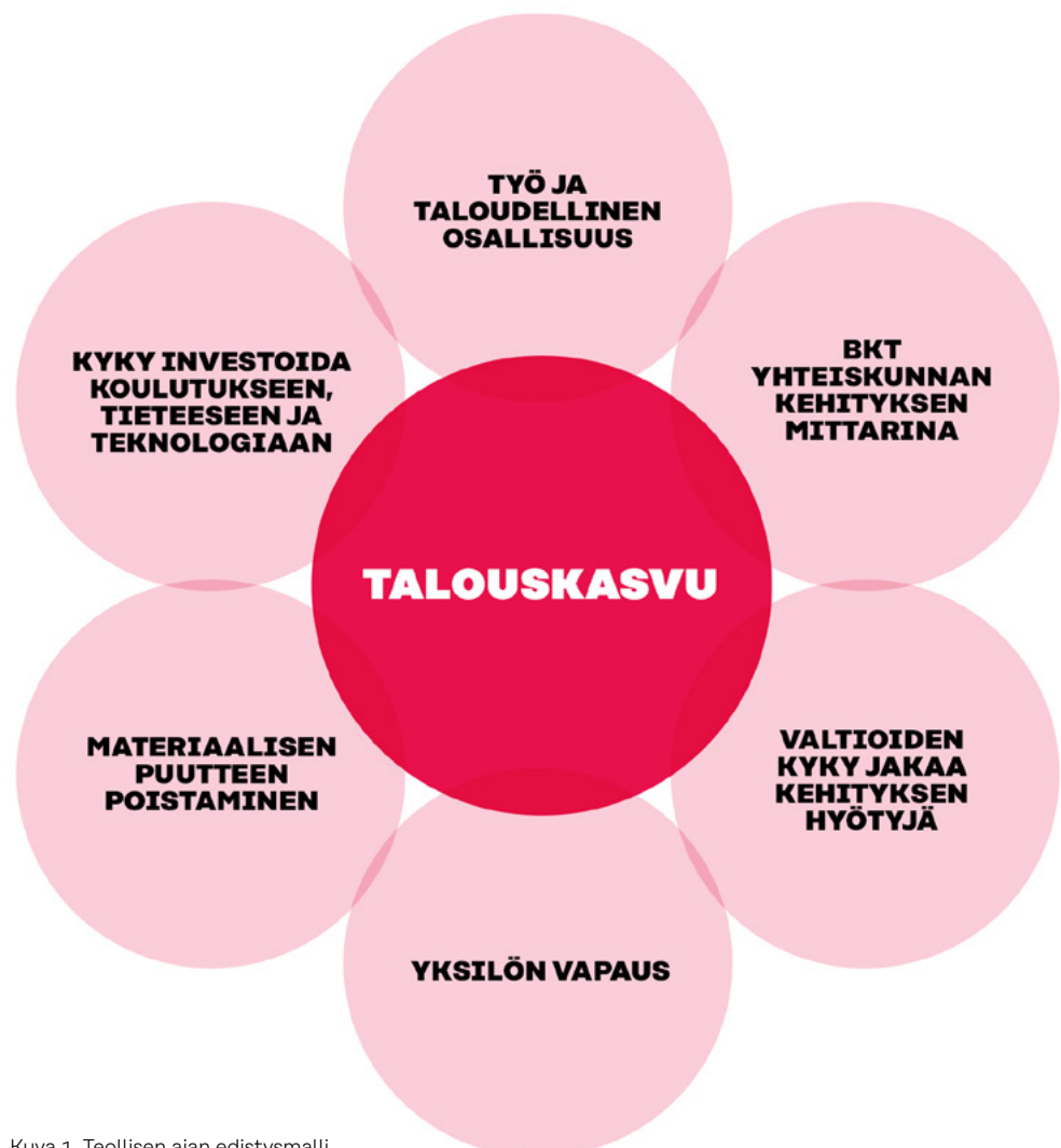
Kuva 1. Teollisen ajan edistysmalli

Ennen uuden mallin luonnostelemista on hyvä verrata sitä teollisen ajan edistysmalliin, joka perustui (ja perustuu yhä) materiaalistien tarpeiden tyydyttämiseen nopean talouskasvun kautta. Tämä malli on kuvassa 1.