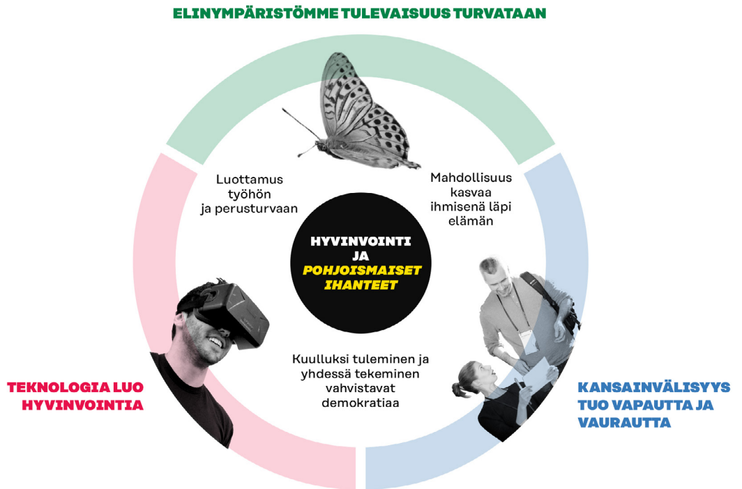
Kuva 3. Hyvinvoinnin seuraava erä arjen kokemuksena.

Hyvinvoinnin seuraavassa erässä uusi työ ja työelämä näyttävät mahdollisuutena ja ihmiset voivat luottaa perusturvaan, joka kantaa elämäntilanteesta riippumatta. Jokaisella tulisi olla mahdollisuus oppia ja kasvaa ihmisenä läpi elämän. Toimiva demokratia, nähdyksi ja kuulluksi tuleminen, dialogi ja yhdessä tekeminen vahvistavat osallisuutta ympäröivään yhteiskuntaan. (Kuva 3.)