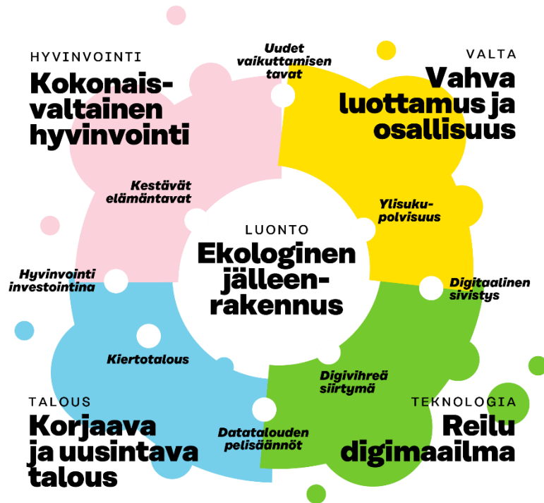
Kuva 2. Tulevaisuuden mahdollisuuksia