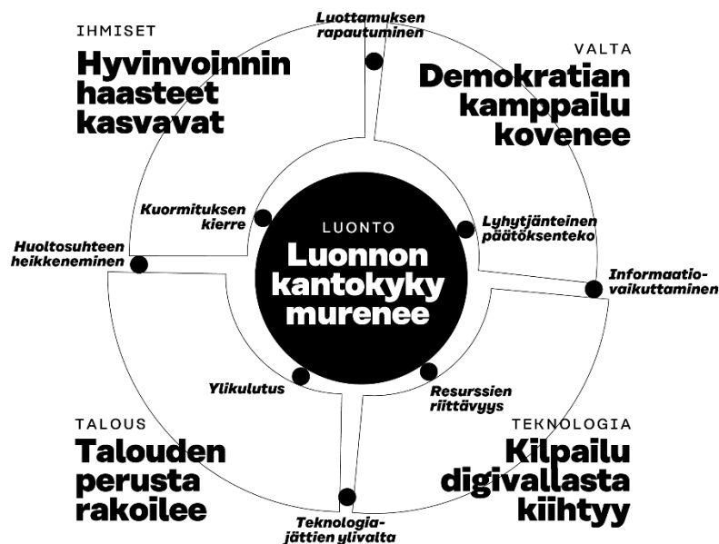
Kuva 1. Muutosten kokonaiskuva ja ratkaistavat haasteet

Sitran megatrendit 2023 kuvaavat muutoksen kokonaiskuva viiden teeman kautta, joita ovat luonto, valta, teknologia, talous ja ihmiset (kuva 1). Viimeaikaiset isot kriisit, koronapandemia ja Venäjän hyökkäyssota moninaisine seurauksineen, ovat tehneet aiempaa konkreettisemmin näkyväksi keskinäisriippuvaisen maailman. Olemme yhä vahvemmin siirtyneet postnormaaliin aikaan, jota värittävät yllätykset, ristiriitaisuudet ja konfliktit. Epävarmuuden lisääntyessä korostuu tarve ymmärtää muutosten kokonaiskuva ja megatrendien välisiä kytköksiä ja jännitteitä.